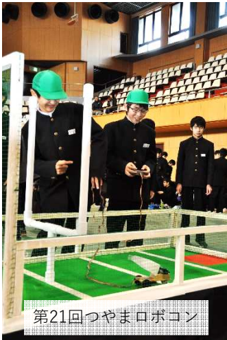
第21回つやまロボコン

12月17日(日)津山総合体育館にて開催される第22回つやまロボットコンテスト(主催ザ・チャレンジ実行委員会)の参加チームの募集が始まりました。