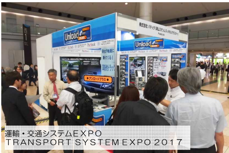
運輸・交通システムEXPO TRANSPORT SYSTEM EXPO 2017

また、5月24~26日、東京ビックサイトで行われた「運輸・交通システムEXPO TRANSPORT SYSTEM EXPO 2017」に株式会社パドックと山陽熱工業株式会社、株式会社MGHが共同開発した自動荷台昇降トラック「アンロードプラス」を出展しました。