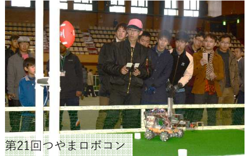
第21回つやまロボコン

また、冬季オリンピックに出場する女子アイスホッケー日本代表「スマイルジャパン」にも熱いご声援を。