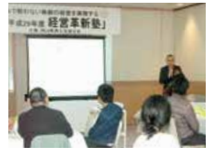
今年度の経営革新塾の様子

このセミナーは毎年実施している「経営革新塾」の事前説明会です。「経営革新計画」とは、 あなたの会社の「新しい取り組み」 をスタートするきっかけになるもので、承認を受けると行政や金融機関など対外的な信用も増し、補助金や融資などの面で優遇されやすくなるなどメリットが多数あります。今回のセミナーではその経営革新計画