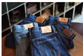
有限会社内田縫製 4