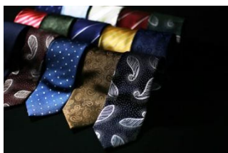
株式会社笏本縫製 9

「MADE IN TSUYAMA」とは優れたデザイン、高い技術、高い品質を持った津山市内事業者による商品を日本そして世界に送り出すためのプロジェクトです。平成27年よりスタートし、既に4つの商品がデビューし、それぞれファクトリーブランドとしても認知が高まっています。