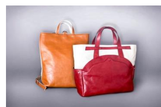
有限会社末田工業所