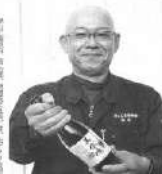
健康野菜として評価