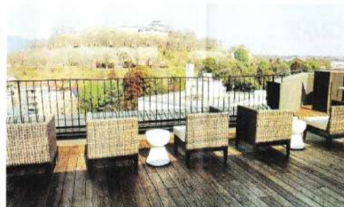
展望テラスラウンジ「スパリビング&テラス」(9階)の眺望。津山城(鶴山公園)の全景が目の前に広がる