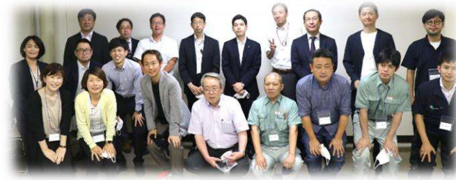
つやま産業塾 塾生の皆さま