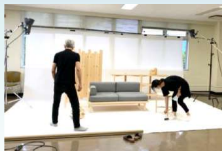
デザイナーと写真家による TSUYAMA FURNITURE 撮影会

地元産材の魅力を最大限に引き出しながら現代の生活スタイルに合わせてデザインされた「TSUYAMA FURNITURE 津山家具」を是非ご覧ください！