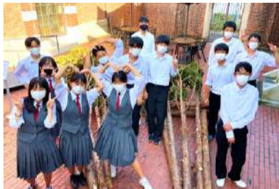
東高の生徒の皆さんと センター職員(中央奥)

10月8日(金)に津山東高校1年生が総合的な探究の時間の取り組みの一環(同校呼称:行学)として、農林業や福祉班等に分かれ、分野フィールドワークを実施しました。つやま産業支援センターでは、商工業分野の班の講師として、疑問や質問に対し、助言や応答をさせていただきました。生徒の皆さんからは「産業支援にゴールがないことが驚いた」「津山に人が残ったり戻るとの仕組みを考えたい」など心強い意見や感想をいただきました。