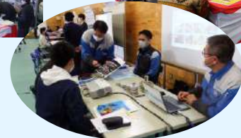
会員企業のブースで説明を受ける学生