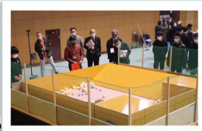
(写真上) 高校一般の部競技 (写真左) 海外チームとのオンライン交流