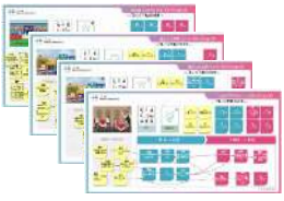
↑ワークショップ成果の一例 ←今回はZoomで行いました