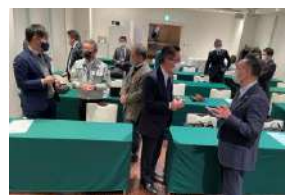
交流する参加者の皆様