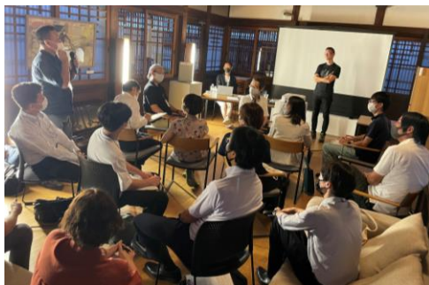
つやま産業塾 第26期の様子